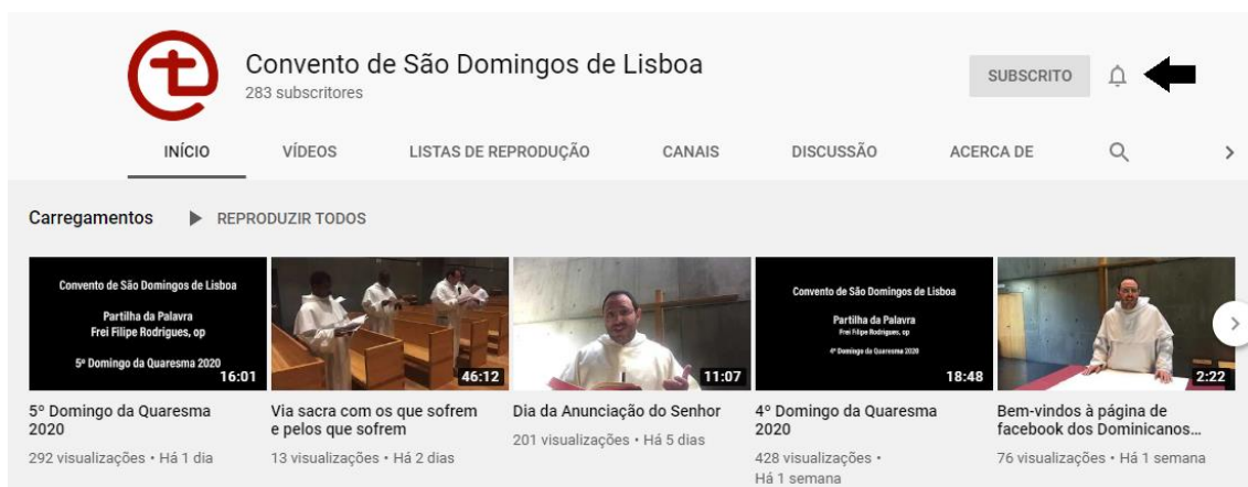
Figura 2 – Activar as notificações do canal.