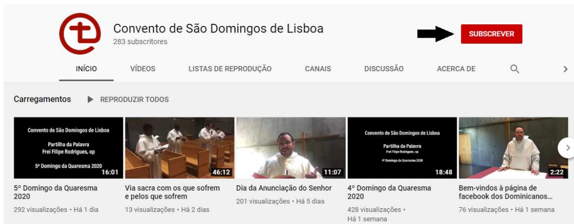
Figura 1 – Subscrever a um canal de youtube .