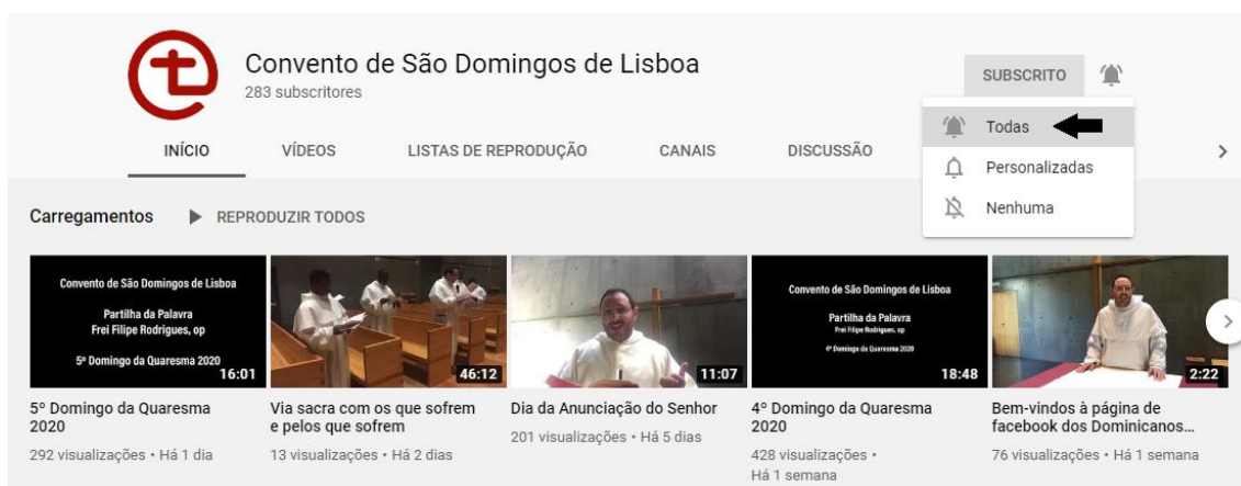
Figura 3 – Opção para activar as notificações do canal.

Já está subscrito ao canal e com todas as notificações activadas.